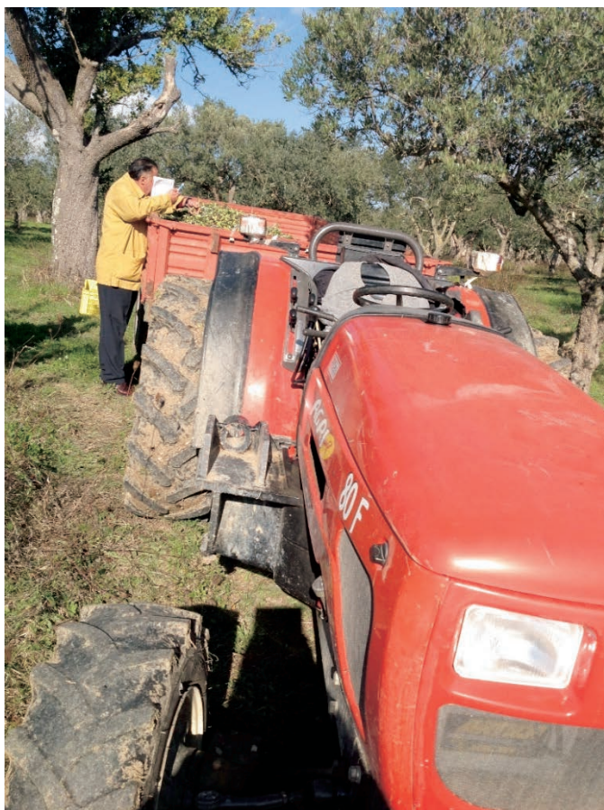
Figura 15: Trasporto olive al frantoio - Azienda Agricola Guerrea - S. Lupo (BN)

Il settore olivicolo rappresenta un importante comparto produttivo, con una produzione di circa 484.000 tonnellate di olive che vengono raccolte principalmente nel periodo che va da novembre a dicembre.