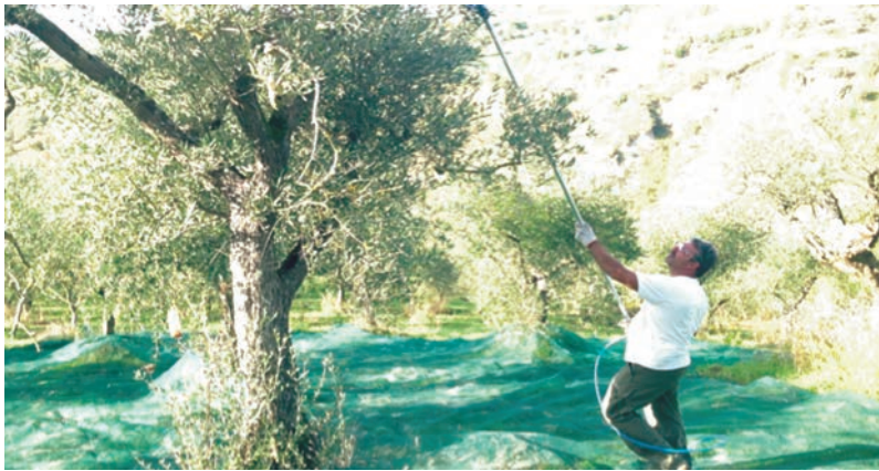
Figura 9: Raccolta delle olive con uso di abbacchiatore -Az.Agr. -Ariano Ir (AV)

Il sistema di raccolta a terra fa ricorso all'uso di reti in plastica stese al suolo. L'organizzazione del lavoro di raccolta prevede tre fasi fondamentali: distribuzione dei contenitori vuoti in campo, raccolta del prodotto, carico e trasporto dei contenitori pieni.