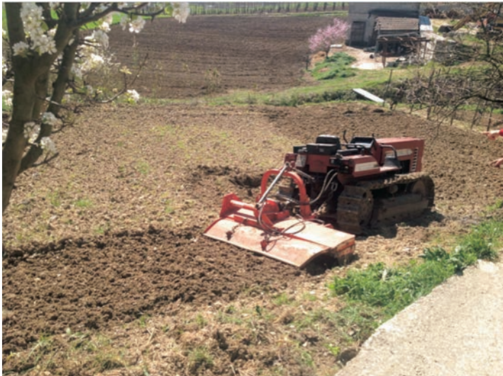
Figura 3: Trattore durante la fresatura su terreno impervio - az agr. Grasso Gelsomino - Calabritto (AV)

I rischi legati alla concimazione sono quelli relativi all'impiego delle macchine, ovvero ad: