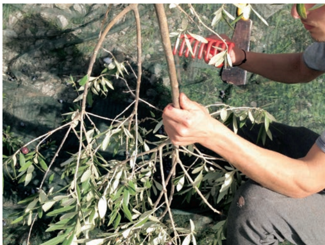
Figura 13: Raccolta delle olive con uso del pettine - Azienda Agricola Maglione - Moiano (BN)