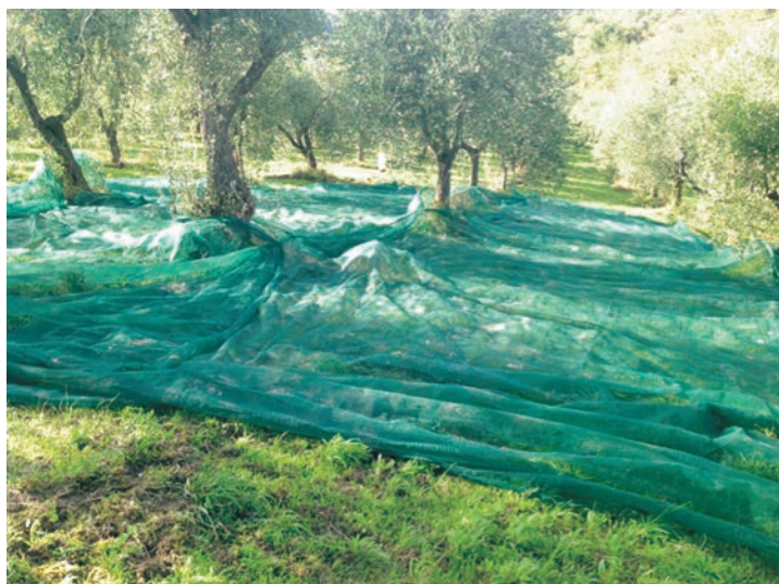
Figura 1: Una fase della raccolta delle olive - Az. agricola Moscartolo Pasquale - Grottaminarda (AV)