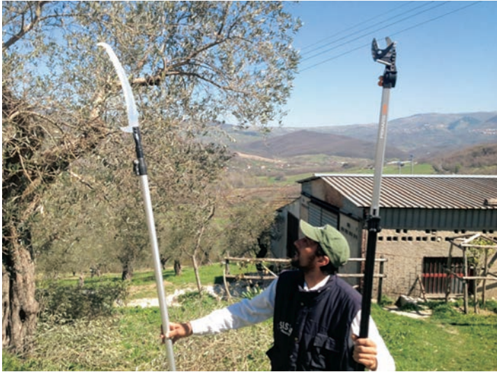
Figura 5: Attrezzi per la potatura - Azienda Agricola Grasso Gelsonimo - Caposele (AV)