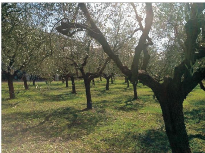
Figura 2: Oliveto in coltivazione - az agr. Minichiello - Grottaminarda (AV)

La gran parte degli oliveti, soprattutto in Campania, sono ubicati in zone collinari e aride, comunque senza impianti irrigui. Pertanto, la conservazione della fertilità del terreno richiede l'adozione di sistemi di gestione sostenibili, che non prevede l'utilizzo di frequenti e profonde lavorazioni meccaniche.