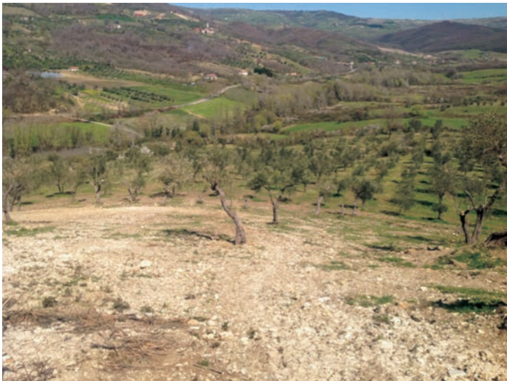
Figura 4: Tipico terreno adibito ad oliveto - az agr Casale Agnese -Valva (SA)

La gran parte degli oliveti campani, come abbiamo già accennato in precedenza, sono ubicati in collina e pertanto richiedono l'adozione di sistemi di gestione sostenibili, che non comportino l'uso di frequenti e profonde lavorazioni meccaniche, fino ad introdurre tecniche di "non-lavorazione". Un terreno lavorato assorbe più rapidamente e in maggiori quantità, l'acqua piovana rispetto a un terreno condotto con tecniche di "non-lavorazione". Per tale ragione le tecniche di "non lavorazione" diventano sempre più diffuse e incentivate nelle zone collinari e sui terreni impervi. Ciò nonostante, in presenza di terreni con le caratteristiche geomorfologiche sopra descritte diventa indispensabile un uso dei mezzi meccanici adeguato, che eviti rischi per i lavoratori e per l'ambiente.