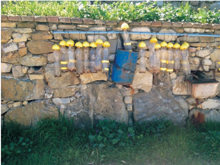
Figura 8: Metodo di difesa biologico dai fitofagi - Az Agr. Grasso Pasquale - Caposele (AV)

Tuttavia, gli agricoltori riferiscono, che in presenza di forti attacchi, come negli ultimi anni, l'utilizzo della trappola al feromone sessuale da sola non sia molto efficace. Pertanto, in presenza di fenomeni sempre più frequenti per i mutamenti climatici in atto, si può prevedere l'uso di insetticidi irrorati su tutta la pianta in funzione larvicida. Il numero di trattamenti necessari con il metodo curativo può variare, in dipendenza dell'andamento climatico e della varietà, da 1 a 3; nelle zone più esposte agli attacchi della mosca essi vengono eseguiti normalmente in agosto, settembre e ottobre-novembre.