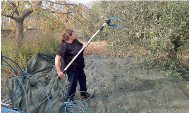
Figura 10: Raccolta delle olive con uso di abbacchiatore - Azienda Agricola - Campoli MT (BN)