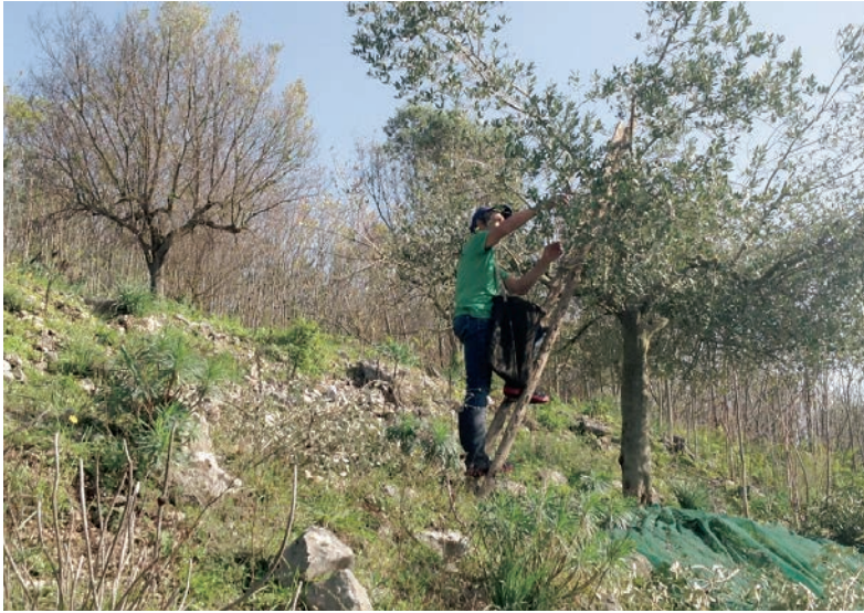
Figura 14: Raccolta delle olive con uso del pettine - Azienda Agricola Maglione - Moiano (BN)

I pericoli per i lavoratori nascono quando si sale sugli alberi senza utilizzare le scale che solitamente sono di legno o di alluminio.